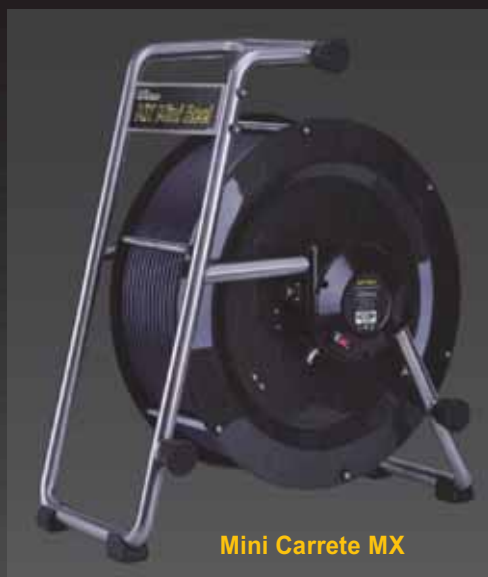
Mini Carrete MX